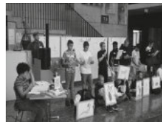
kreativ und zukunftsfähig