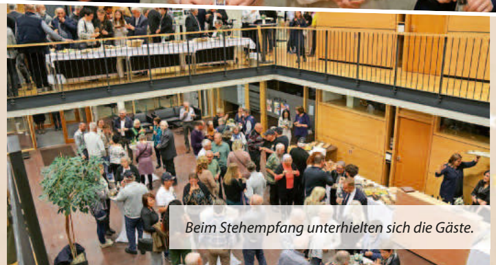
Beim Stehempfang unterhielten sich die Gäste.