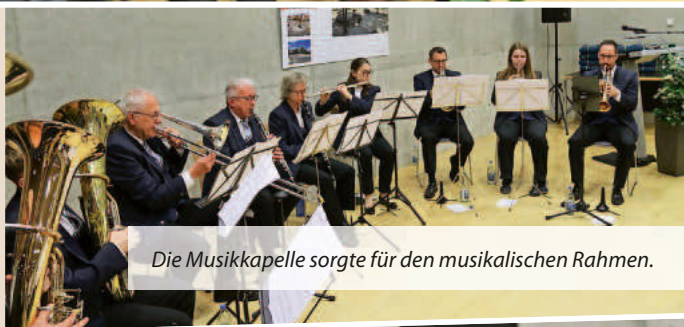
Die Musikkapelle sorgte für den musikalischen Rahmen.