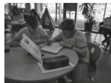
individuell und kompetent