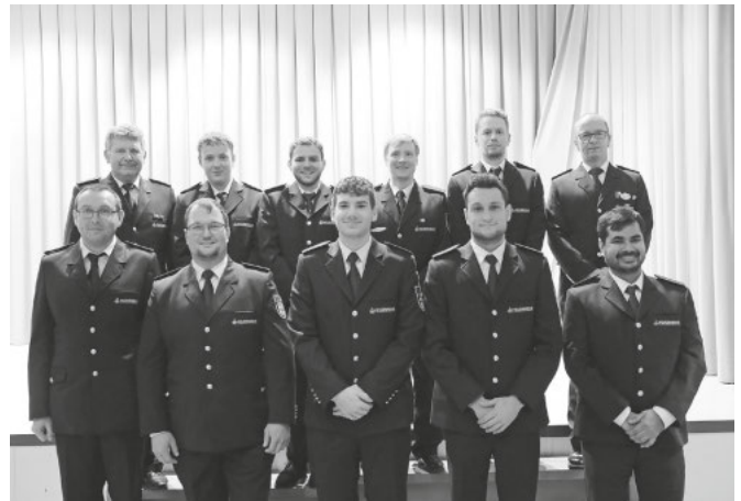
Die Beförderten der Feuerwehrabteilung Schwandorf.